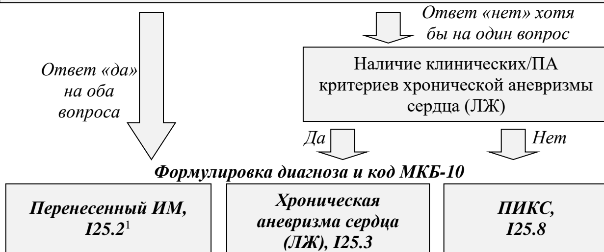
Рис. 1. Принципы формулировки диагноза и выбора кода МКБ-10 при перенесенном ранее ИМ

• Диагноз ИМ был установлен ретроспективно (спустя 28 сут. от начала его развития)? • Какие-либо клинические проявления, связанные с перенесенным ранее ИМ (в т.ч. ХСН, нарушения сердечного ритма и проводимости), отсутствуют?